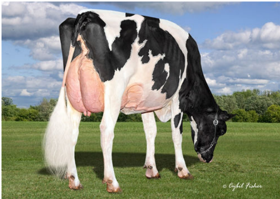
SIEMERS DOC HANAN 28286 GRANDDAM