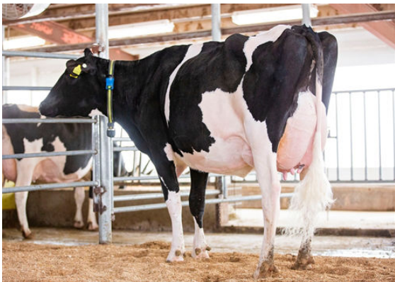
SIEMERS LSTR HANAN 33317 DAM